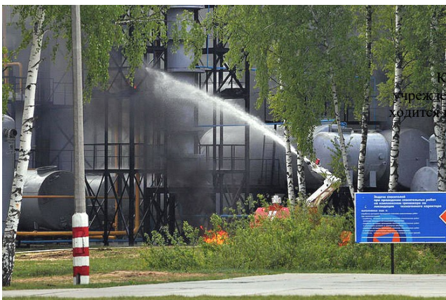
Краевое учреждение ДПО «Институт региональной безопасности» по адресу:

воздержаться от употребления водопроводной или колодезной воды, а также овощей и фруктов из огородов и садов до заключения специалистов об их безопасности.