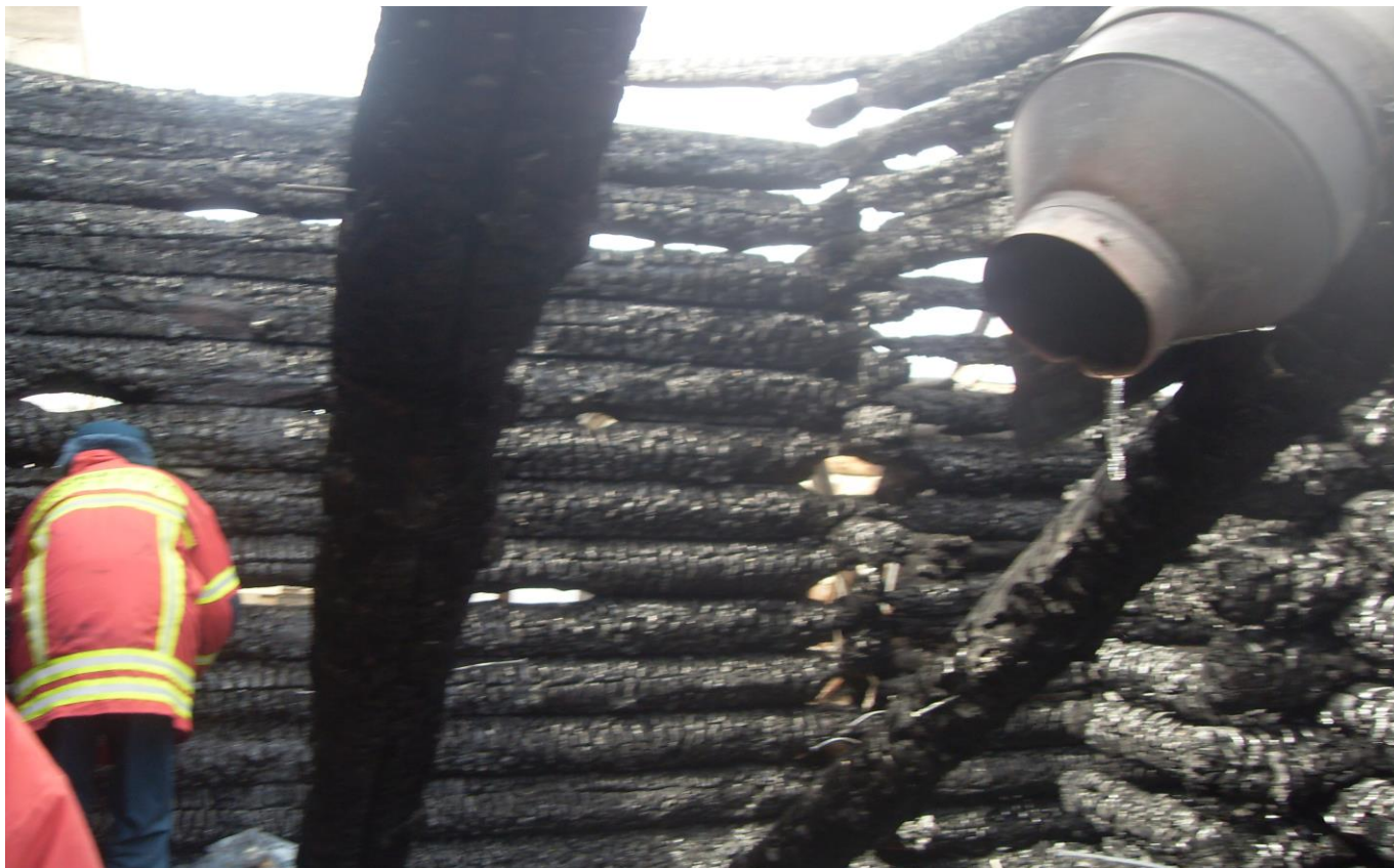
На месте пожара работают эксперты пожарной лаборатории ФГБУ СЭУ ФПС ИПЛ по Красноярскому краю.

Часто можно услышать, что пожар – это чистая случайность, да и то, возникающая только у людей, ведущих асоциальный образ жизни. Практика показывает, что это