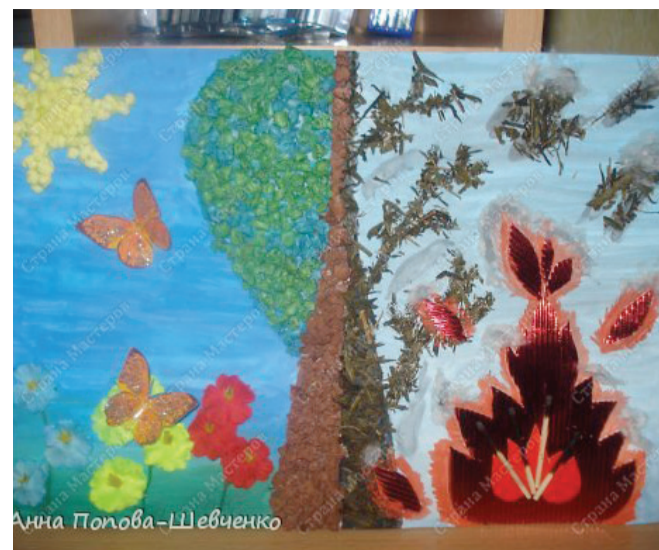
Инспектор отделения организации надзорной деятельности ОНД по г. Красноярску ст. лейтенант внутренней службы С.В. Очкина

Поделки могут быть выполнены практически и из природного материала. Например, для такой цели можно использовать шишки, желуди, каштаны, сухие листья и веточки, из которых получаются прекрасные поучительные поделки на тему пожарной безопасности.