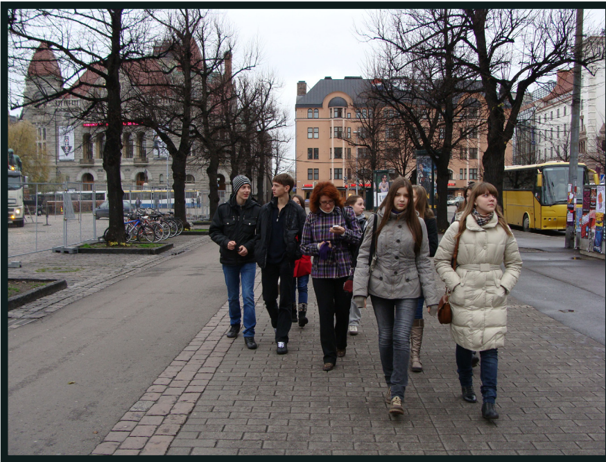
А мы идем, шагаем по Хельсинки...