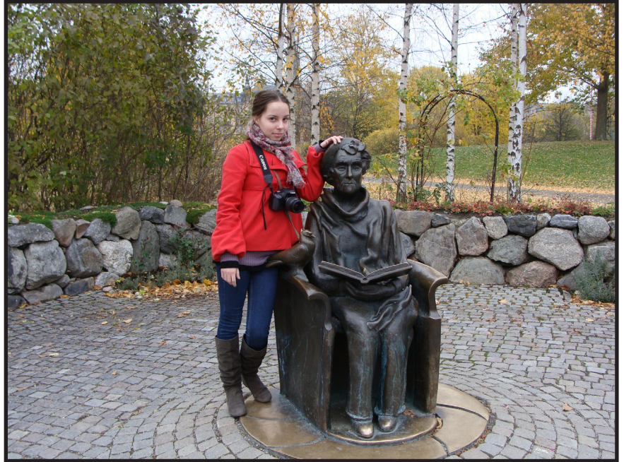
Памятник Астрид Лингрен

Обзорная экскурсия подходит к концу, и теперь мы едем в Юнибаккен – знаменитый на всю Швецию музей сказки. Нас предупреждают: там всегда много народу, поэтому мы приезжаем к самому открытию. Вдобавок у нас организованная экскурсия, что дает нам преимущество: мы не стоим в огромной очереди, чтобы