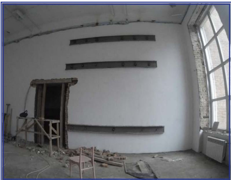
Укрепление стен в спортивном зале