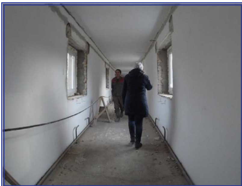
Переход в столовую