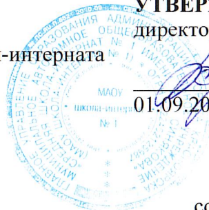
График работы социального педагога Суших Л.П.